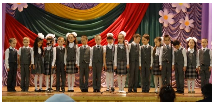
Победители конкурса народной песни – коллектив 1 класса