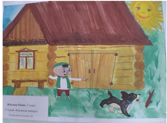
«Кызыклы шәкерт», Юсупов Ринат