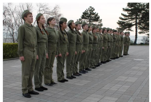
Конкурс строя и песни