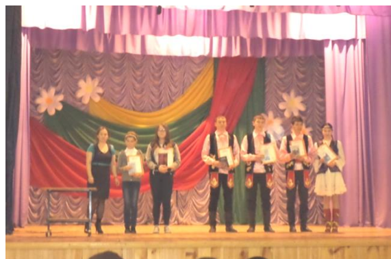
Победители и призеры предметных олимпиад, творческих конкурсов, спортивных соревнований