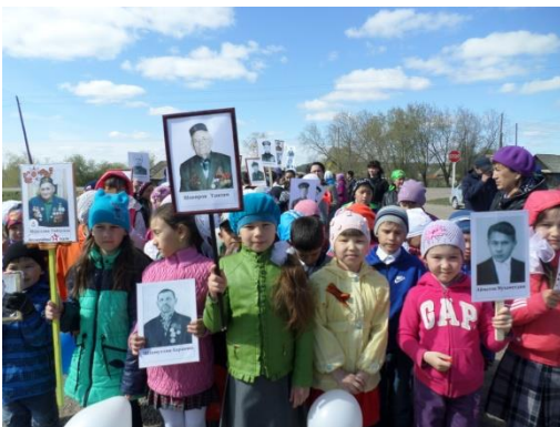
Шествие «Бессмертного полка»