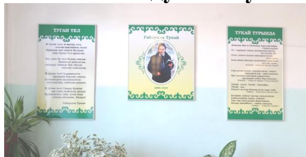
Уголок, посвященный татарскому народному поэту Г.Тукаю