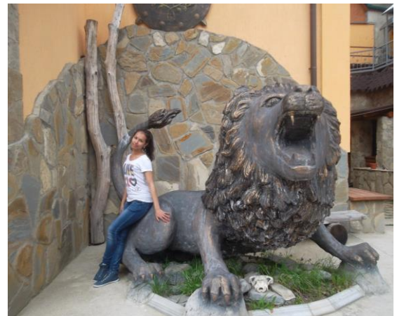
На Красной поляне